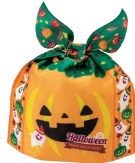
タイパンプキン ハロウィンゴーストF P