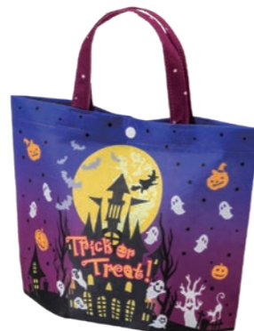
シンプルトート ミニF P