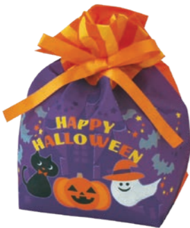
巾着 リボン小F P