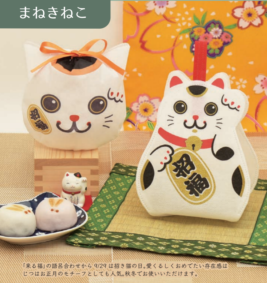
「来る福」の語呂合わせから9/29は招き猫の日。愛くるしくおめでたい存在感はじつはお正月のモチーフとしても人気。秋冬でお使いいただけます。