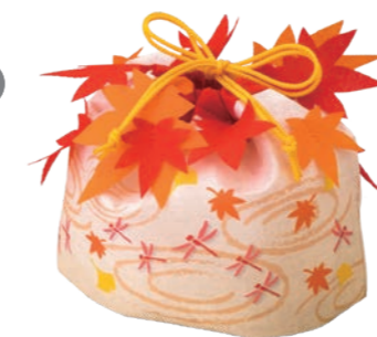
もみじ巾着 波紋とんぼF P