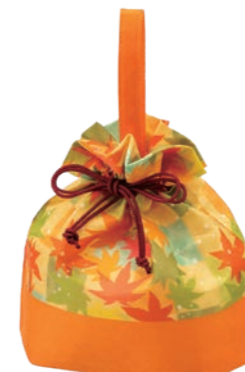
手提げ巾着 F P