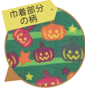
スクエア巾着 ハロウィンゴーストF P