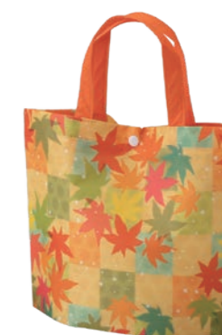
シンプルトート ミニF P