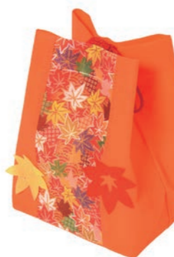
信玄袋 U 紅葉