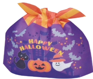
タイパック S F P