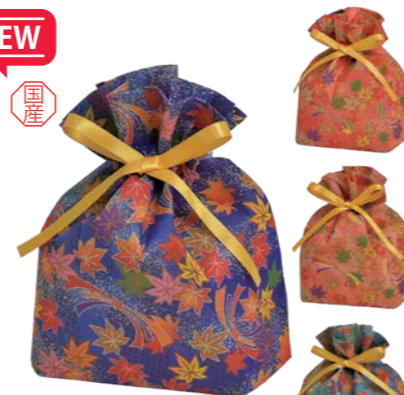
巾着 リボン小F P