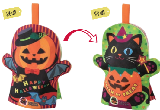
パペット 小パンプキンキャットF P