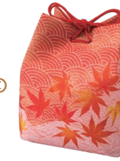
信玄袋 F P