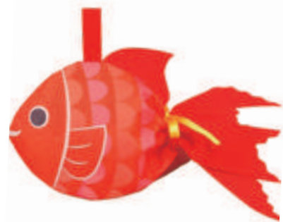
金魚 ポップうろこ F.P. Vセット