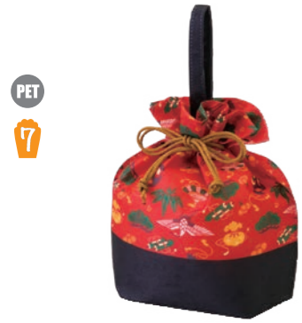
手提げ巾着 F P LA445 宝尽くし柄 S 内寸: 130×152×100 外寸: 130×213×100 M 底板/厚紙、PP ロープ

十二支がランダムに描かれている、 てまり巾着はリボンにリニューアル して華やかになりました。