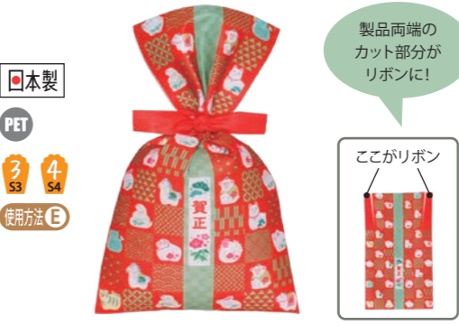
日本製 PET 3 4 タイリボン F P 干支柄 LB066DF S3 LB067DF S4 S3 内寸: 150×163 外寸: 150×250 S4 内寸: 170×203 外寸: 170×300