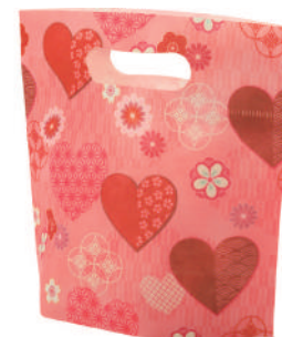
小判抜きバッグ ミニ F P LB065DM ハートジャポネ柄 S 内寸：110×140×80 外寸：110×190×80 O 納品時の横幅 190(mm)