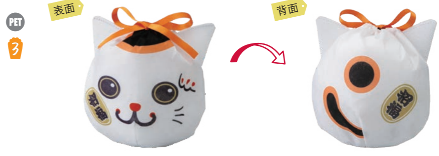
PET 3 おてだま巾着 F P LA441 まねきねこ柄 S 内寸: 170×160 外寸: 170×180 M PP 不織布、サテンリボン C 巾着部のみサイズとなります。耳部分はこのサイズに含まれません。