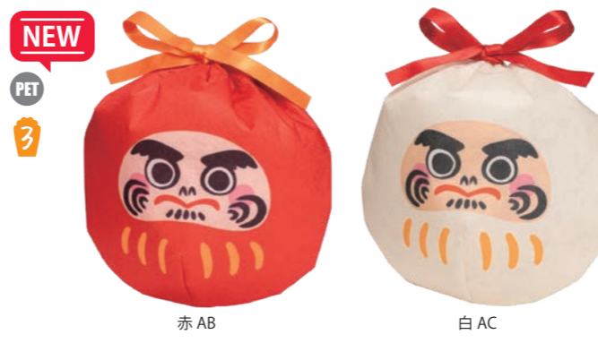
NEW PET 3 おてだま巾着 F P LA559AB だるま柄赤 LA559AC だるま柄白 S 内寸: 170×160 外寸: 170×180 M PP 不織布、サテンリボン