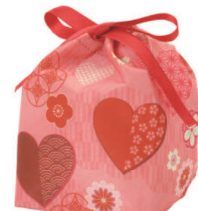
てまり巾着 リボン 特小 F P LA523 ハートジャポネ柄 S 内寸：100×125×92 外寸：100×150×100 M 底板 / 厚紙、サテンリボン