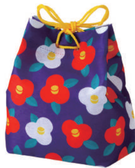
信玄袋 F P LA476 椿柄 S 内寸：134×153×96 外寸：134×175×96 M 底板 / 厚紙、PP ロープ