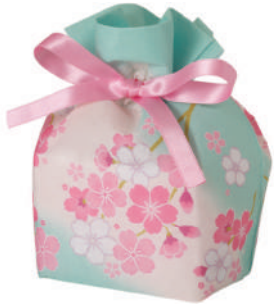
巾着 リボン 特小F P

LA543 桜日和(さくらびより)柄 S 内寸: 100×125×92 外寸: 100×190×100 M 底板/厚紙、サテンリボン