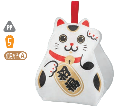
PP 5 まねきねこ LE162 S 内寸: 138×107×107 外寸: 144×176×113 C 開口部は幅 92×奥行 62(mm)