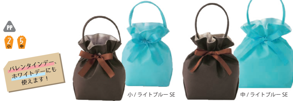
PP 2 小 5 中