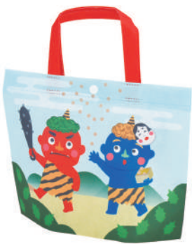
シンプルトート ミニ F P LA541 節分鬼柄 S 内寸：146×158×74 外寸：146×175×74 M プラスチックホック O ホックで開閉します。