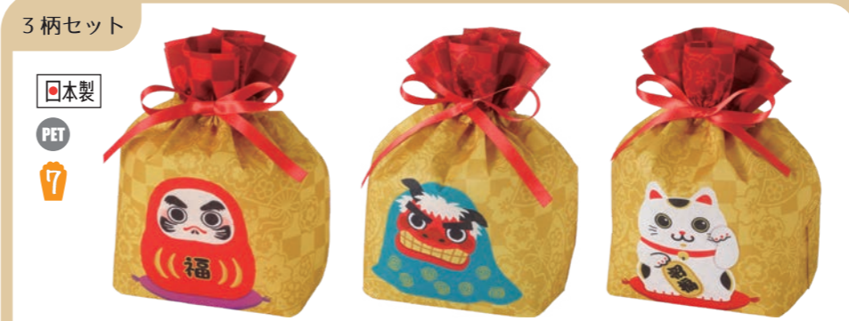
3柄セット 日本製 PET 7 巾着 リボン小 F P LA521 招福キャラ柄セット ※1セット(20枚)の購入で3柄が揃う便利なセットとなっております。それぞれ何枚入るかはおまかせください。 S 内寸: 130×150×100 外寸: 130×215×100 M 底板/厚紙、サテンリボン