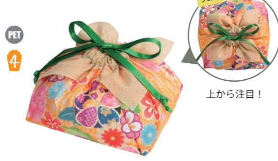
ふろしき巾着 F P LA553 みやび橙柄 S 内寸: 130×92×128 外寸: 130×110×128 M PP 不織布、サテンリボン