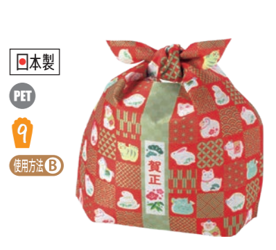
日本製 PET 9 タイパック M F P LB064DF 干支柄 S 内寸: 140×173×100 外寸: 140×188×100 C 納品時の全長 330(mm)