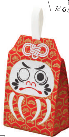
お守り LE208 S 内寸：120×160×70 外寸：126×200×76