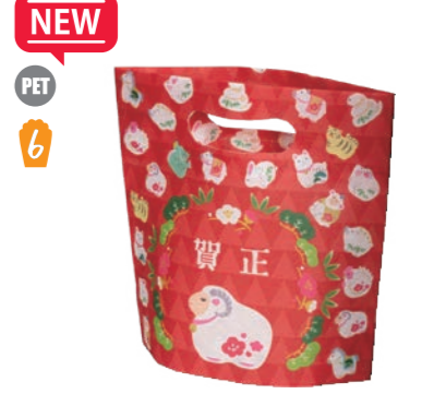
NEW PET 6 小判抜きバッグ ミニ F P LA561 干支未(ひつじ)柄 S 内寸: 110×140×80 外寸: 110×190×80 C 納品時の横幅 190(mm)