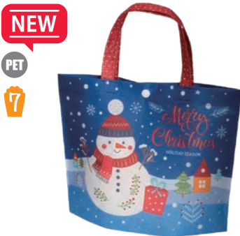
NEW PET 7