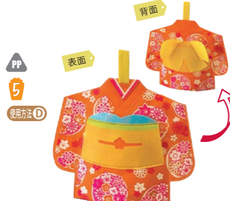
晴れ姿 LA326 華づくし柄 S 内寸: 116×175×70 外寸: 257×210×70