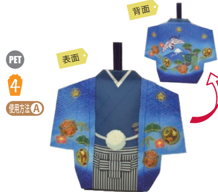
スリットタイプ 羽織袴 F P LA497 S 内寸: 118×176×70 外寸: 257×210×70 M PP 不織布 C 全面プリントタイプです。