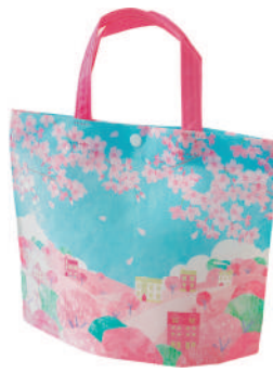
シンプルトート ミニF P

LA504 桜に染まる街柄 S 内寸: 146×158×74 外寸: 146×175×74 M プラスチックホック O ホックで開閉します。