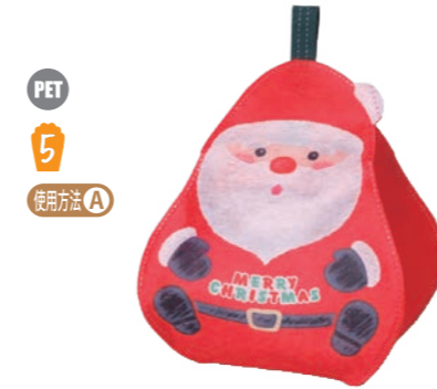
PET 5 使用方法 A