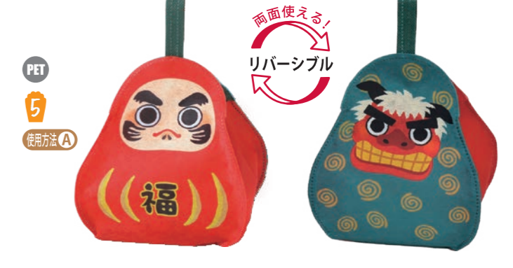
PET 5 両面使える! リバーシブル ころりん F P LA500 だるまししまい柄 S 内寸: 138×107×108 外寸: 144×158×114 M PP 不織布 C 開口部は幅 92×奥行 62(mm)