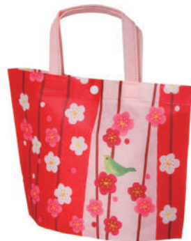
シンプルトート ミニ F P LA540 梅うぐいす柄 S 内寸：146×158×74 外寸：146×175×74 M プラスチックホック O ホックで開閉します。