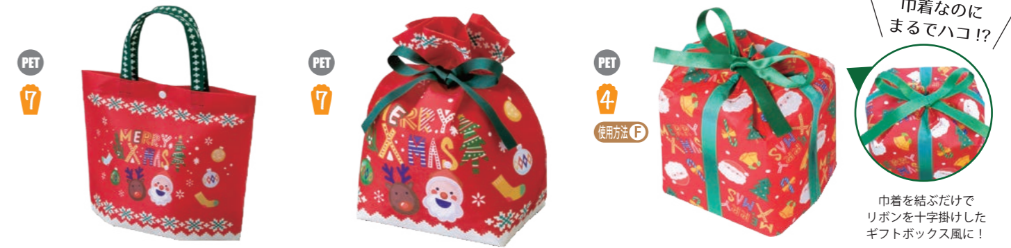
シンプルトートミニF P