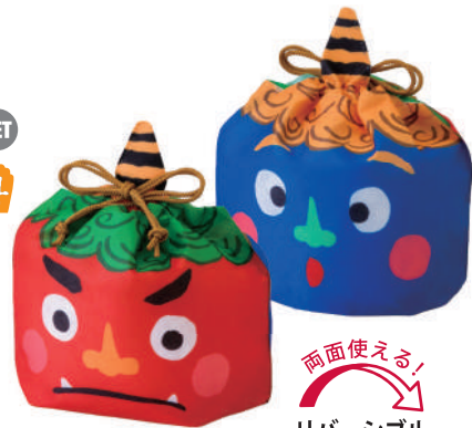
節分鬼巾着 F P LA452 S 内寸：100×125×100 外寸：100×150×100 M 底板 / 厚紙、PP ロープ