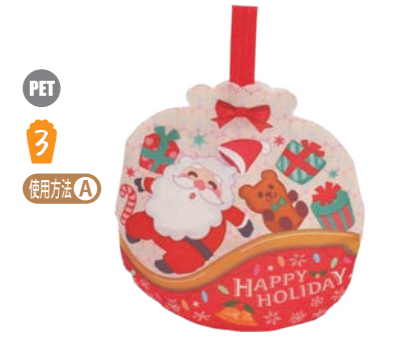
PET 3 使用方法 A