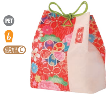
信玄袋 F P LA518 みやび赤柄 S 内寸: 134×153×96 外寸: 134×175×96 M 底板/厚紙、PP ロープ