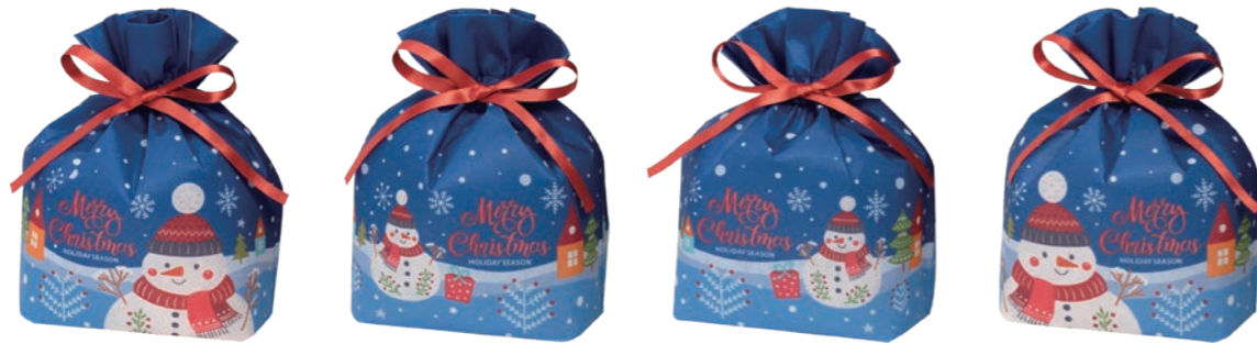
巾着 リボン小F P