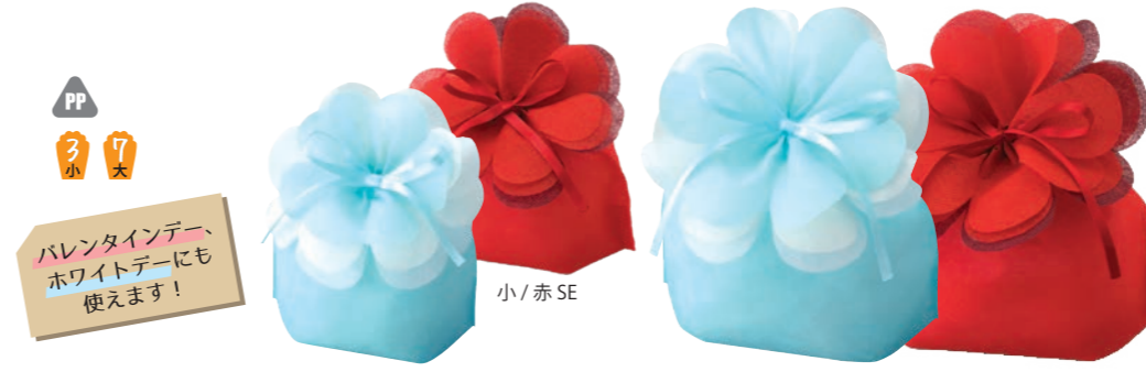
PP 3 小 7 大