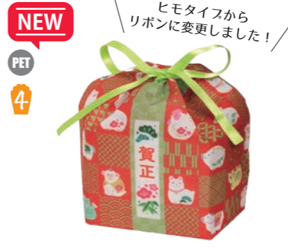
NEW PET 4 てまり巾着 リボン 特小 F P LA560 干支柄 S 内寸: 100×125×92 外寸: 100×150×100 M 底板/厚紙、サテンリボン