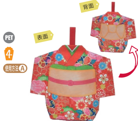
スリットタイプ 晴れ姿 F P LA498 みやび赤柄 S 内寸: 118×176×70 外寸: 257×210×70 M PP 不織布 C 全面プリントタイプです。