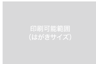
印刷可能範囲(はがきサイズ) W150mm×H100mm (縦横はどちらでも可能です。)