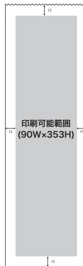
LS005 加工後のサイズ 120W×385H