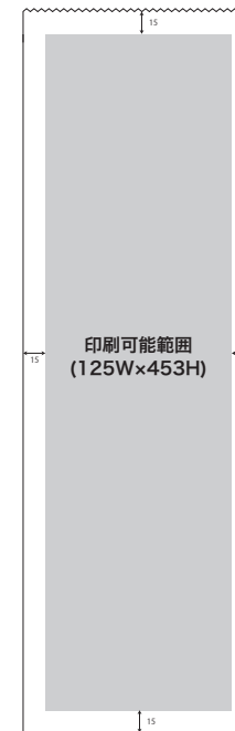
LS006/LS256 加工後のサイズ 155W×485H ※ただし高さ方向の印刷サイズは420mmまで