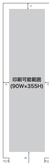
LS005 加工後のサイズ 90W×385H×30D