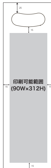
LS005 120W x 400H