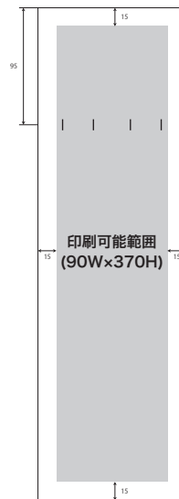
LS005 120W x 300/400H