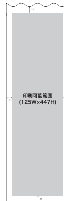
LS006/LS256 加工後のサイズ 155W×485H ※ただし高さ方向の印刷サイズは420mmまで